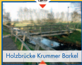
Holzbrücke Krummer Barkel