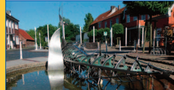
Der Esenser Marktplatz mit dem Tidebrunnen

Mit dem Fahrrad (10 km) oder zu Fuß (2,5 km)