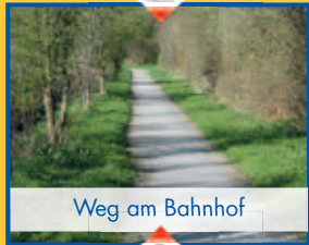
Weg am Bahnhof